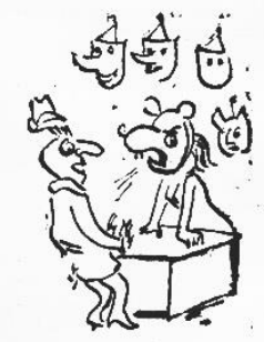
Вошла в роль

Смешайте 80 граммов белого столового вина, 30 граммов московской водки, 20 граммов воды, 15 граммов консервированных фруктов (черешню, вишню, виноград), — 25 граммов ликера или вишневого домашнего настоя, сок четверть лимона или 10 граммов лимонной кислоты и добавьте 30 граммов льду. Для горячего коктейля та же рецептура, только вместо белого вина берется красное. Вино подогревают без фруктов —