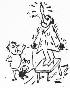
Другой раз не забудешь купить елочку.